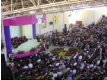
Renovacion Carismatica Catolica

La Renovación Carismática Católica a nivel mundial, es una corriente de Gracia, en Guatemala está reconocida como un movimiento de apostolado seglar que labora desde diciembre de 1973, cuya acción principal es la Evangelización.